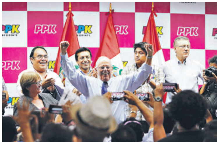
►► Kuczynski celebra anoche en su comando en Lima.